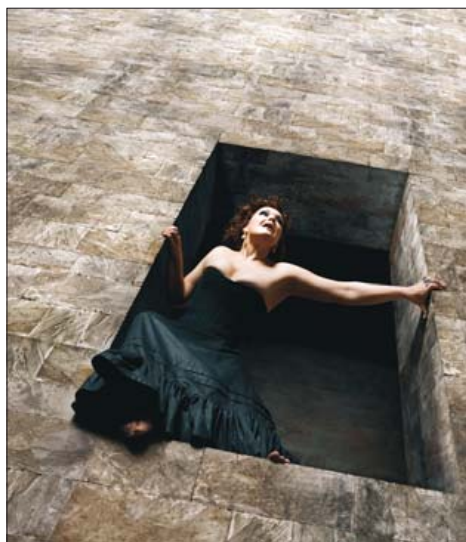
Karita Mattilaa pääsee Jyväskylässäkin nyt ihaillemaan live-esityksissä elokuateatterissa.

olisi ollut enemmän kuin saleissa on paikkoja. Suuren suosion saavutti myös Tosca, jossa Karita Mattila lauloi nimiroolin.