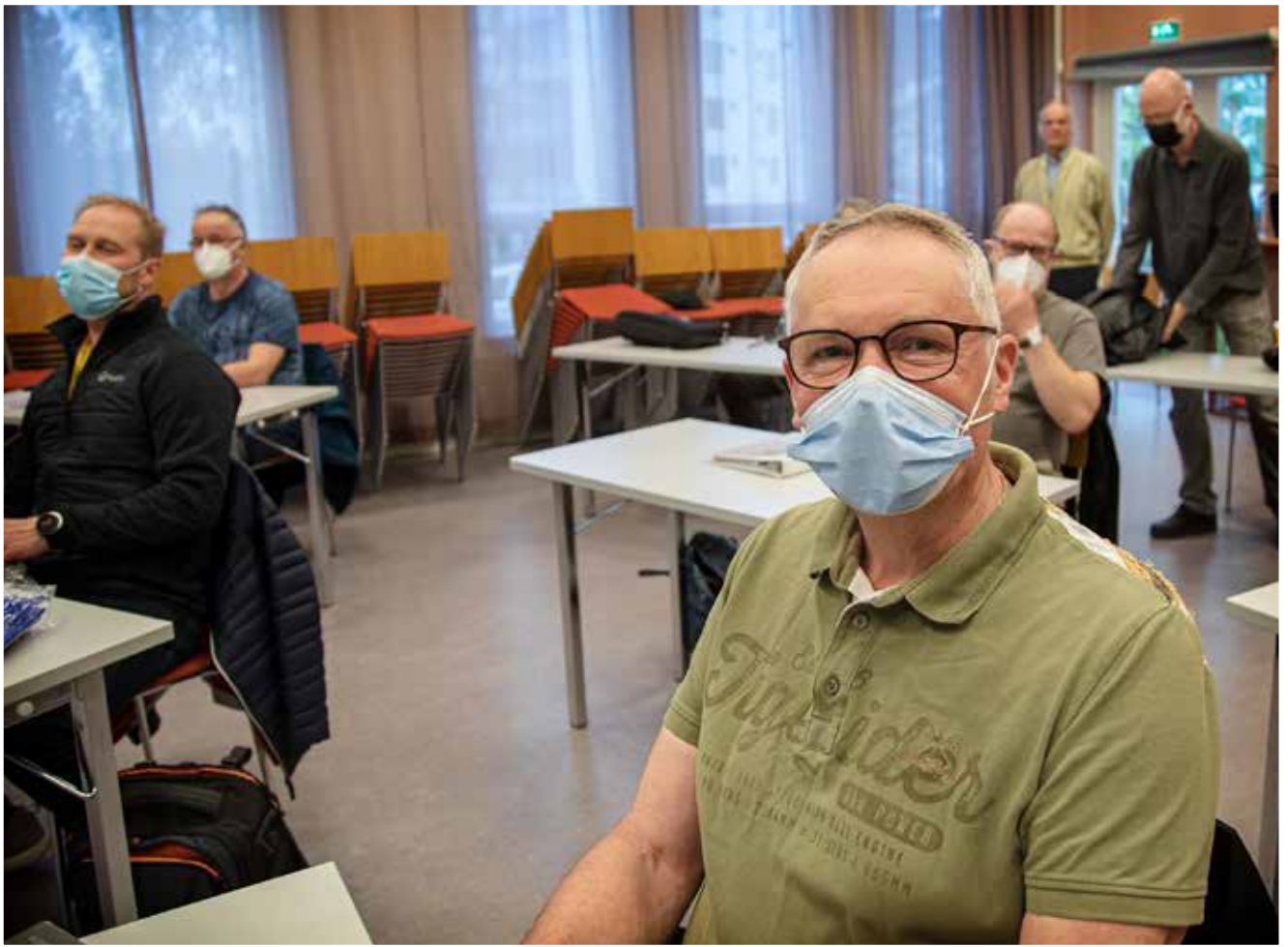
Hymyjä maskin takana